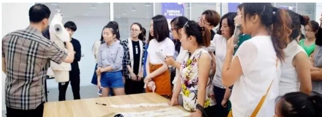
2015 届毕业生创业企业——灏外服饰工作室