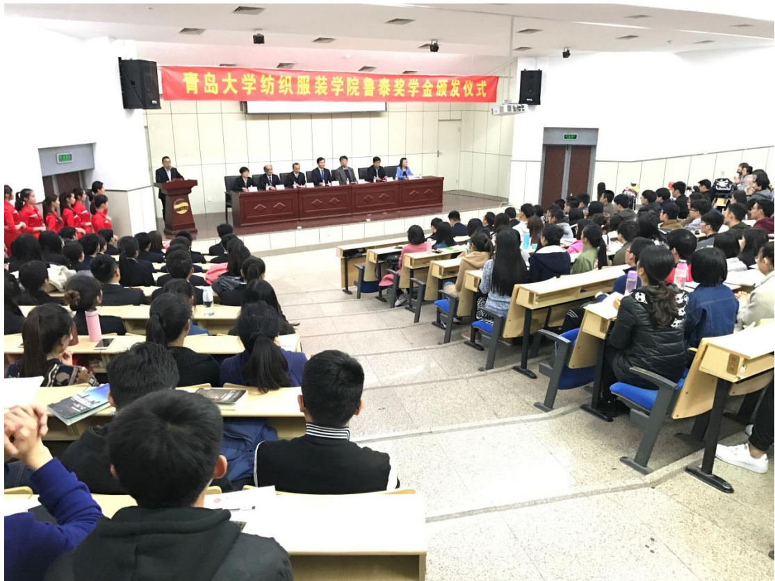
鲁泰奖学金颁发仪式