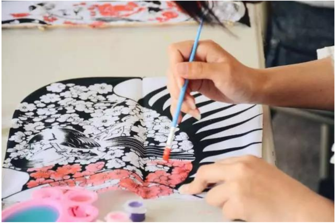
多才多艺的汉服社小伙伴们

创新创业活力迸发： 荣获青岛大学“校长杯”创新创业大赛金奖。孵化出灏外服装、纺配商城、隆德纺织等创业企业，受到社会各界广泛关注。