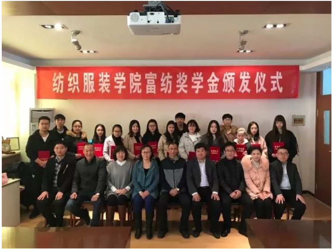
富纺奖学金颁发仪式