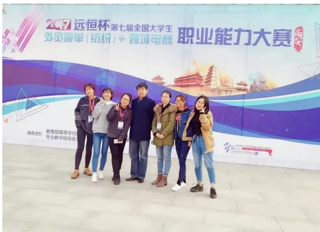
全国跨境电商职业能力大赛