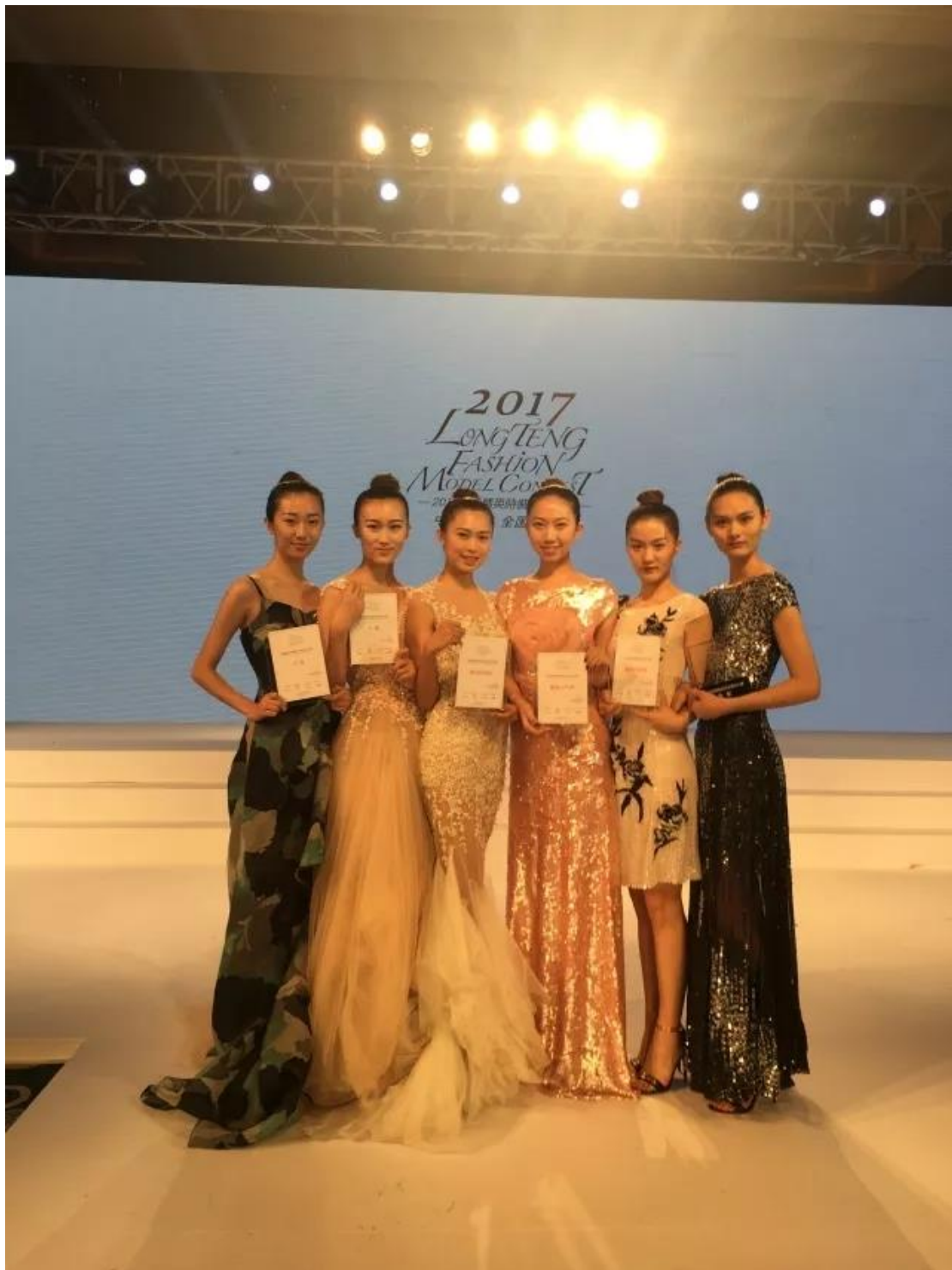
2017 全国精英模特大赛亚军