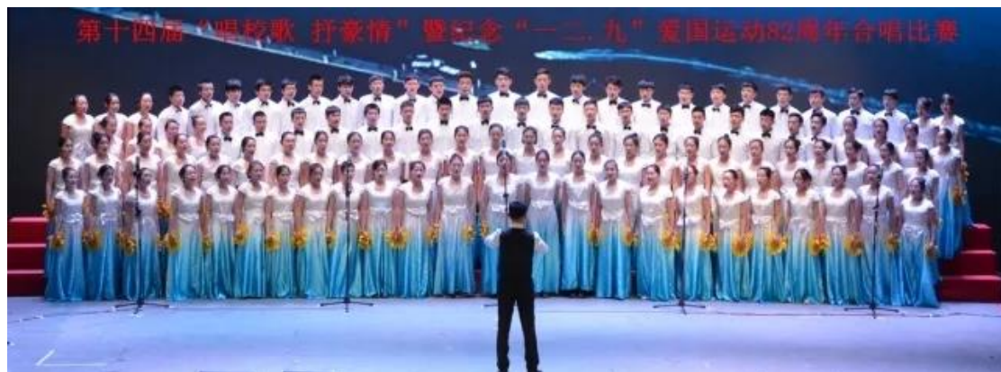
学院梦想合唱团连续两年荣获合唱比赛一等奖