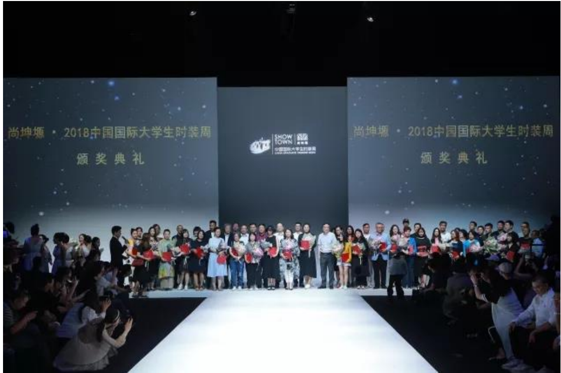
2018 中国国际大学生时装周人才培养成果奖

继续深造率逐年提升 ：2018 年学生考研率达 42%，其中考入“双一流”“重点高校、国外高水平大学的比例达 65%。