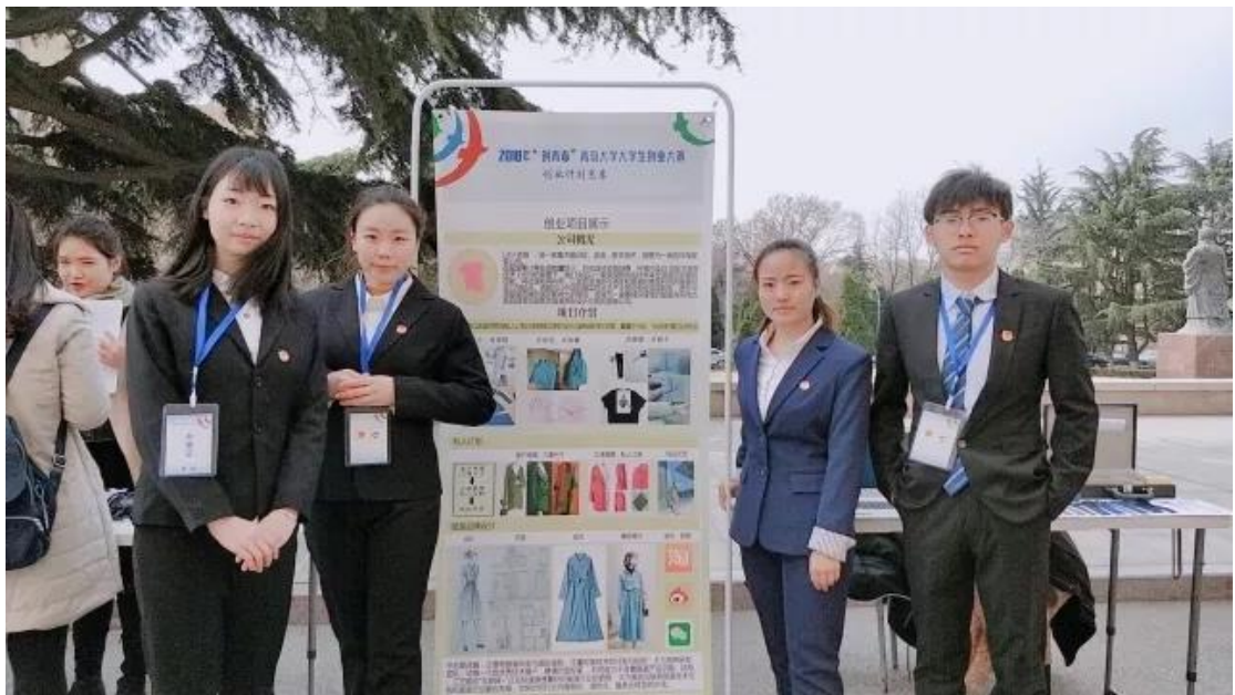
青岛大学“校长杯”创业大赛展风采

创新创业活力迸发： 荣获青岛大学“校长杯”创新创业大赛金奖。孵化出灏外服装、纺配商城、隆德纺织等创业企业，受到社会各界广泛关注。